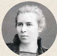
Битим шляхом... Леся Українка