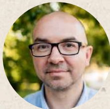
Що Україна дає світові Володимир Єрмоленко

Провокативний текст Сашка Кривенка, який написано в 1993 році і завершується словами "Світ для України!". Особливо цікаво було читати його в парі з текстом Володимира Єрмоленка, що написано через 30 років, у 2023-у, і називається "Що Україна дає світові"